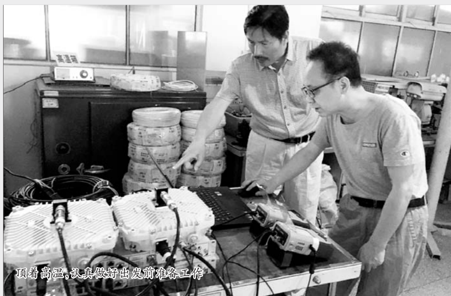
顶着高温，认真做好出发前准备工作

7 月 10 日，西安普天突然接到用户紧急报修，宁夏广电六盘山到罗山段广播电视信号传输，由于用户自行搬迁新建机房，安装调试系统参数造成通信中断，需要尽快解决。此时由于连日来的高温天气，公司生产单位员工都已放假，仅剩值班人员。接到用户电话后，西安普天微波公司总经理决定自己带领 2 名工程技术人员奔赴现场。