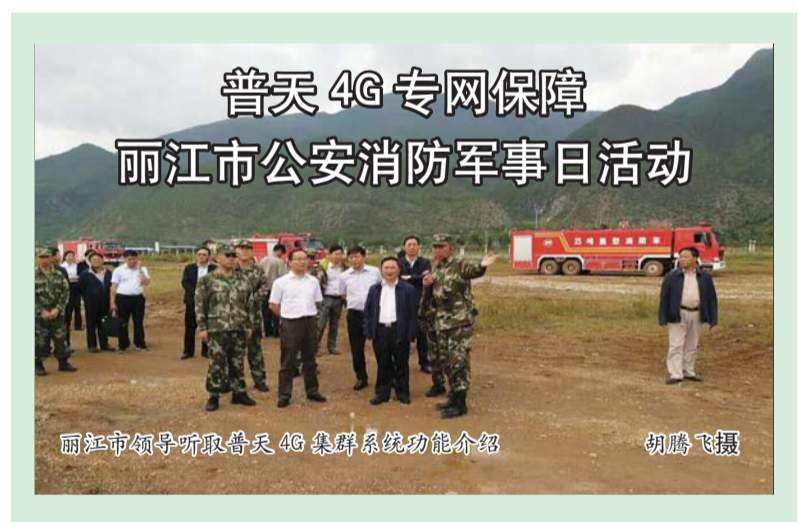
丽江市领导听取普天4G集群系统功能介绍

在现场实战演练中,消防支队战士首先运用无人机、高清DV、手持终端,采集“灾难现场”空中、地面多路视频信息,通过普天便携式4G一体机,将语音、视频、数据、定位等信息实时传输到抗震救灾指挥部,指挥部领导根据回传信息初步评估灾情,提出应急处置工作建议。随后,支队战士演练了精准扩张、精准切割等实战项目,并将现场救援情况向指挥中心领导进行汇报,为指挥部领导指挥调度、部署抗震救灾工作提供了第一手信息。